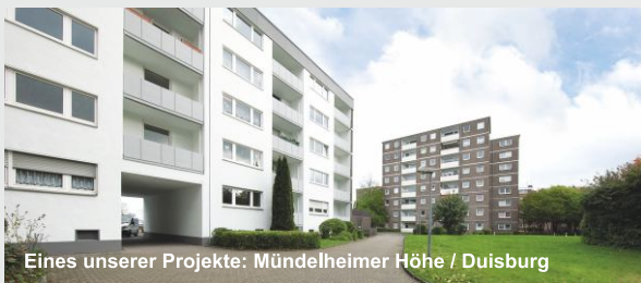
Eines unserer Projekte: Mündelheimer Höhe / Duisburg

Aktuell verwalten wir 8.250 Wohneinheiten sowie 90.000 m 2 Büro- und Gewerbeflächen unter Anderem auch in Duisburg .